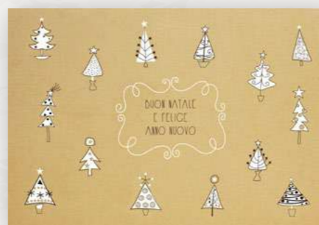
Cod: L0208 LIMITED EDITION fino ad esaurimento